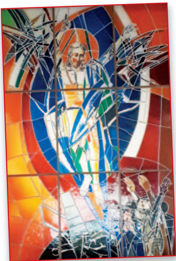
La Pala dell'Altare della nostra Chiesa Parrocchiale

S commetto che chi legge si è già chiesto il significato del titolo dato a questa prima pagina del nostro "Minipress" che quest'anno compie la bella età di 39 anni.