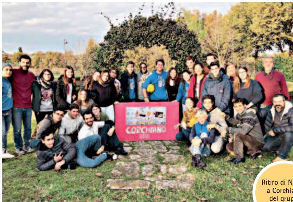
Ritiro di Natale a Corchiano dei gruppi giovanili