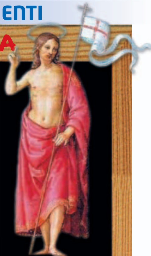
Raffaello Sanzio: "Resurrezione di Cristo" Museu de Arte de São Paulo, San Paolo del Brasile