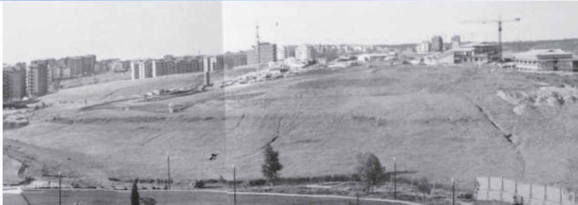
La collina del Nuovo Salario dagli Anni '60 ad oggi