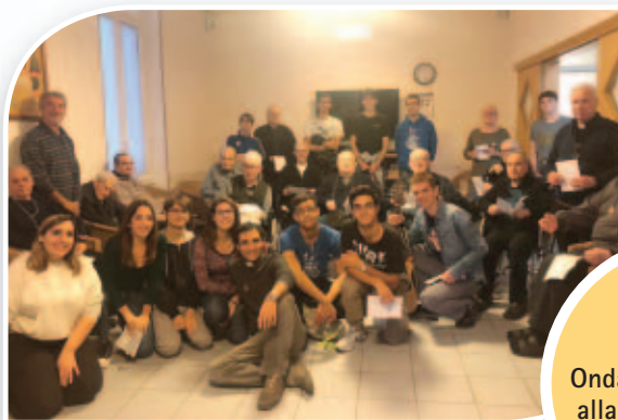
27 ottobre: I ragazzi del gruppo Onda 18:15 in visita alla Comunità Zatti che ospita i salesiani anziani

di vista dell'altro, vedendo e sentendo le cose a partire dal cuore dell'altro. ■